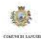
COMUNE DI LANUSEI